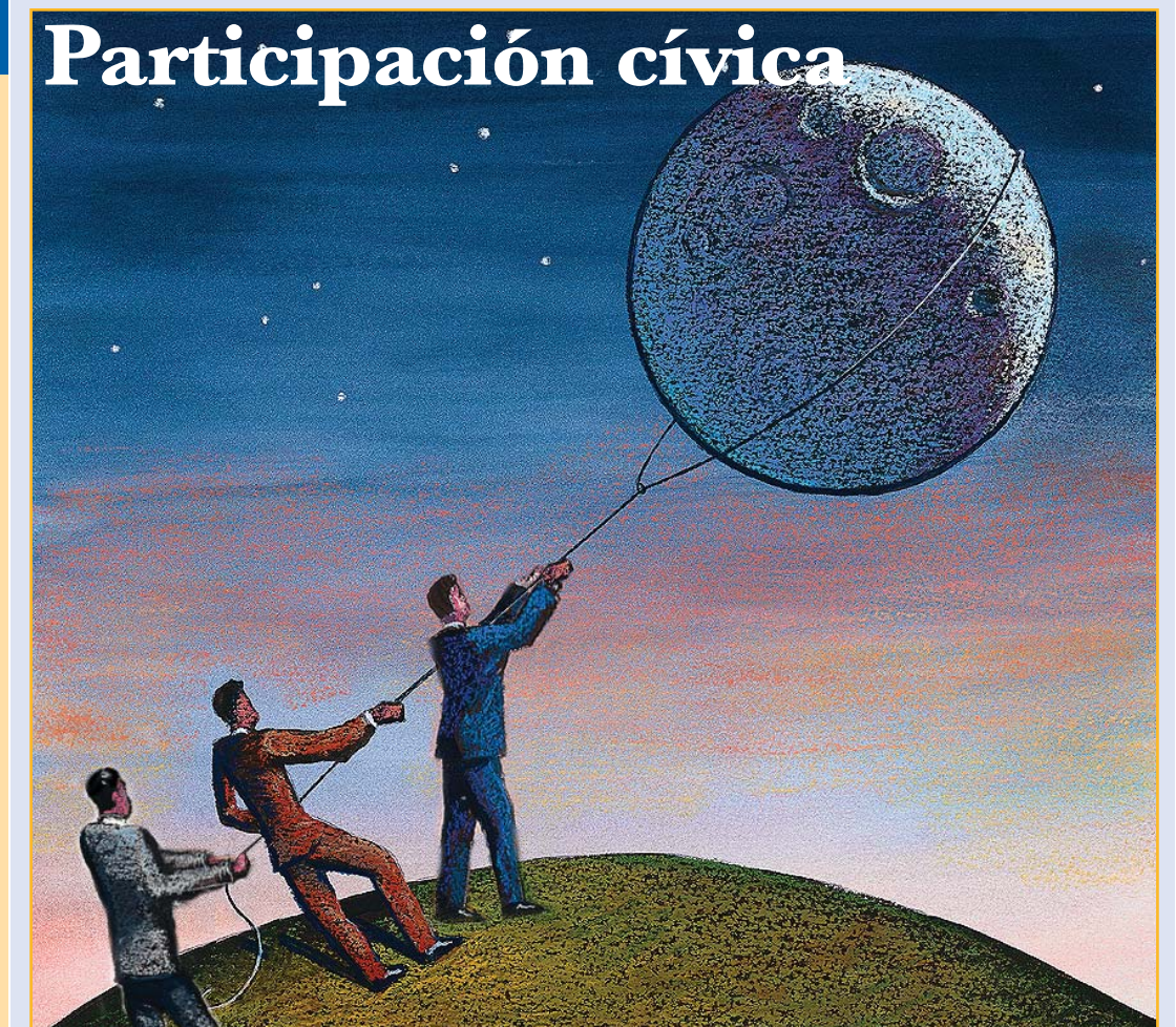
“No cabe duda que un pequeño grupo de ciudadanos conscientes y comprometidos puede cambiar el mundo. Ciertamente, es lo único que lo ha hecho” Margaret Mead.